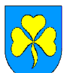
Gmina Pietrowice Wielkie