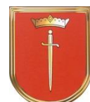
Miasto i Gmina Krzanowice